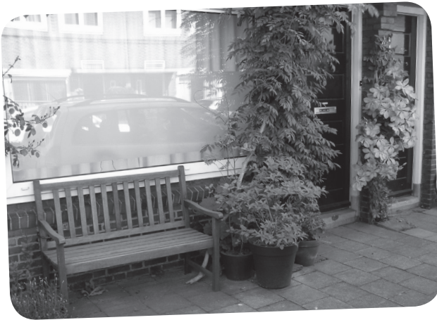
Bloempotten en klimplanten

Afgelopen Groendag is er weer flink geplant in de wijk. Niet alleen in de boomspiegels en de grote bloembakken, maar ook onze tegeltuintjes kregen een opknapbeurt. Voor de BALANS een reden om eens te kijken hoe onze 'voortuintjes' erbij liggen. Wat blijkt: je kunt er van alles mee!