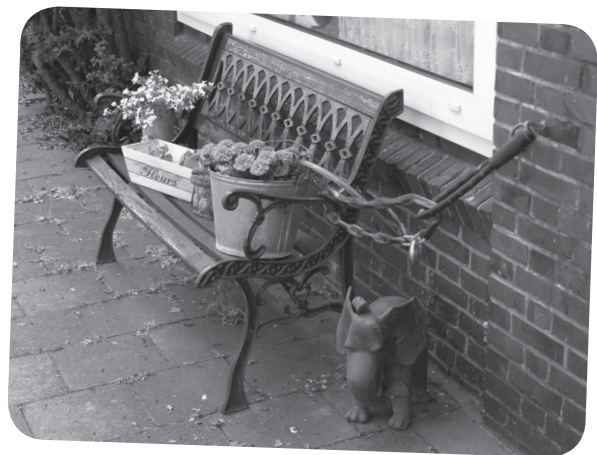
Of met bloemen en mooie beeldjes (Wel goed vastzetten anders is je bankje zo weg!)

Weet jij waar deze foto's genomen zijn? Kinderen tot en met 6 jaar kunnen meedoen aan een wedstrijd: mail een lijstje met de fotonummers en de adressen aan ruth.wolters@gmail.com . Tijdens het buurtfeest wordt de prijs uitgereikt aan de winnaar!