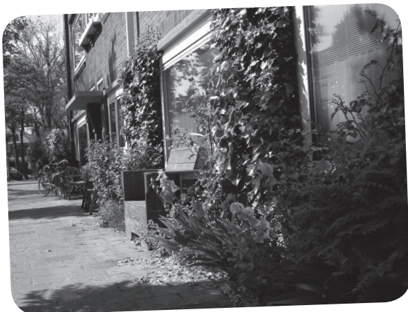
Of gewoon heel veel groen