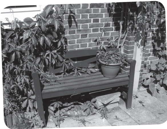
Een bankje met bloemen