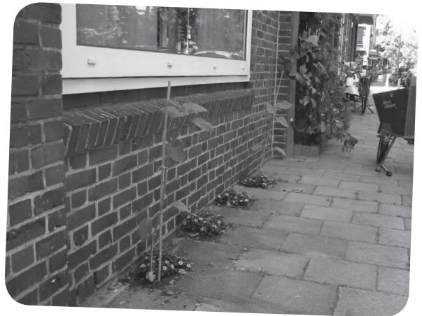
Een smal tuintje