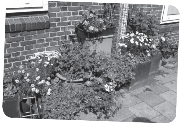
Heel veel bloemen, in de grond en in potten