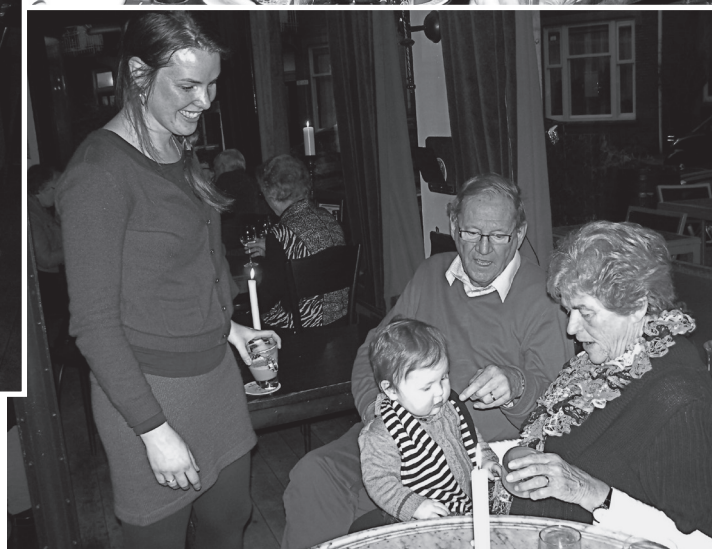
Geslaagde Nieuwjaarsborrel op 13 januari