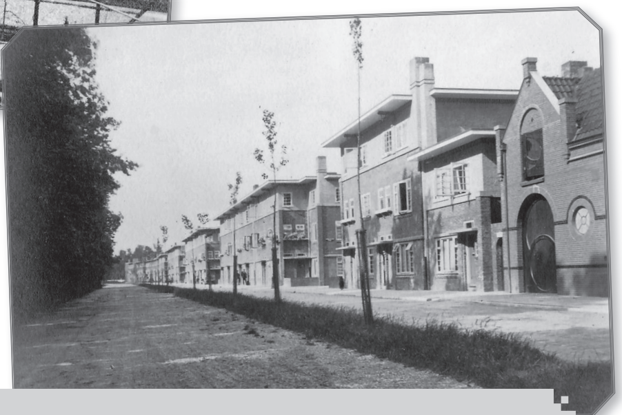
foto 3: Overzicht van de Laan van Minsweerd met aan het begin het koetshuis van de grote hoekwoning "Stadsrand", wat nu studentenhuis "Tout Passe" is.

Wilt u de eerdere edities van de foto's van opa Kisjes nog eens bekijken en heeft u die Balansen niet bewaard? Op www.bansbuurt.nl kunt u onder het tabje Bewonersvereniging oude edities downloaden en bekijken.