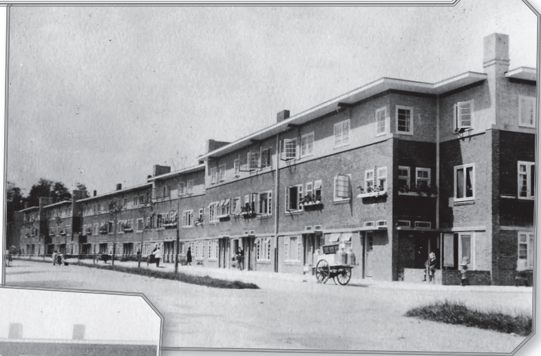
foto 1: Laan van Minsweerd. De ramen staan open en in de bloembakken bloeien de bloemen. Vooraan de foto op straat staat de kar van de melkboer.

In de vorige Balans zag u hoe de steigers werden weggehaald en de ramen en kozijnen geplaatst. Toen lag er nog sneeuw. Inmiddels is het lente, zijn de huizen af en de eerste gezinnen hebben hun nieuwe woning betrokken. Citaat uit het verslag van een voortgangvergadering: 'Uitsprekende onze grote erkentelijkheid voor het door een onvermoeid Bestuur verricht werk kunnen wij mededeelen, dat in den loop van 1922 de bouw van de huizen zeer snel is gevorderd en dat reeds verschillende woningen werden betrokken...'