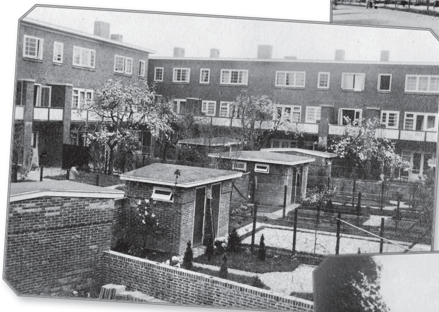
foto 2: Ook in de achtertuinten staat al van alles in bloei. Ziet u de 'roetjes' voor de ramen? Een typisch detail van de Amsterdamse School.

foto 3: Overzicht van de Laan van Minsweerd met aan het begin het koetshuis van de grote hoekwoning "Stadsrand", wat nu studentenhuis "Tout Passe" is.